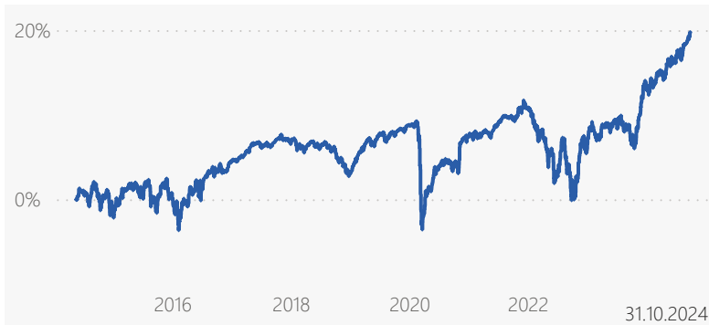
Abb.: die Berechnung dieser Performancedaten erfolgt auf Basis des Preises eines Anteils am Anfang der Periode. Ausschüttungen werden berücksichtigt. Kosten der Verwaltungsgesellschaft und der Verwahrstelle sind ebenfalls berücksichtigt. Ein Ausgabeaufschlag für diese Anteilsklasse fällt nicht an. Zusätzlich mindern das Anlageergebnis individuell anfallende jährliche Depotkosten. Die bisherige Wertentwicklung ist kein Indikator für die zukünftige Wertentwicklung, diese ist nicht prognostizierbar.