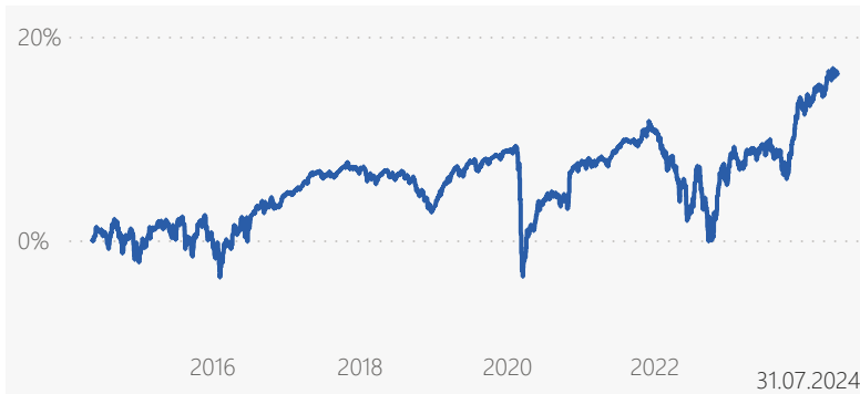
Abb.: die Berechnung dieser Performedaten erfolgt auf Basis des Preises eines Anteils am Anfang der Periode. Ausschüttungen werden berücksichtigt. Kosten der Verwaltungsgesellschaft und der Verwahrstelle sind ebenfalls berücksichtigt. Ein Ausgabeaufschlag für diese Anteilsklasse fällt nicht an. Zusätzlich mindern das Anlageergebnis individuell anfallende jährliche Depotkosten. Die bisherige Wertentwicklung ist kein Indikator für die zukünftige Wertentwicklung, diese ist nicht prognostizierbar.